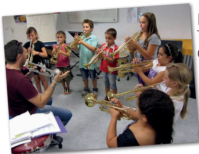
« L'ORCHESTRE À L'ÉCOLE » C'EST TOUTS LES JEUDIS ET ÇA FAIT DU BRUIT!

EN BREF : Vous retrouverez toutes les informations sur les études, les actualités et toutes les disciplines enseignées dans nos locaux. N'hésitez pas à nous faire part de vos remarques.